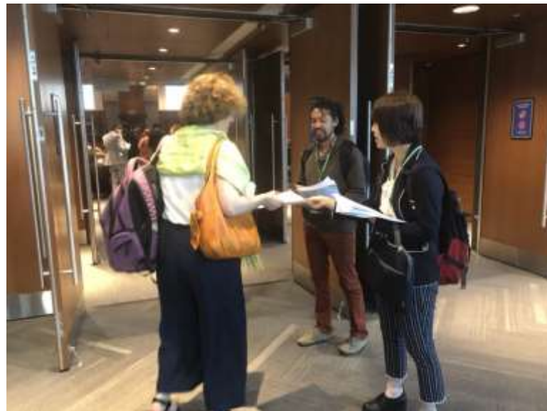
ロビーでチラシを配布する様子